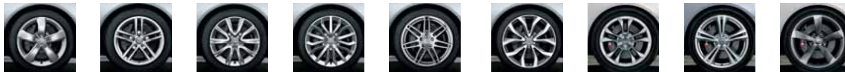
Roues de 18 po pneus toute saison 245/45. 1