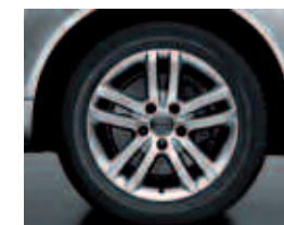
En option sur Ambiente, Ambition Luxe et Avus: jantes en aluminium coulé style 5 doubles branches, 8,5 J x 18", avec pneus 255/55 R 18. Code PRJ