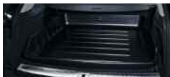
Cuve de coffre