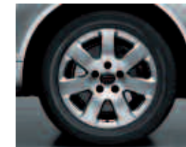
En option sur Ambiente: jantes en aluminium forgé style 7 branches, 8 J x 18", avec pneus 255/55 R 18. Code PRF

Vide-poches dans les contre-portes avant et arrière et sur la console à l'avant, tiroir sous le siège passager avant