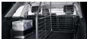
Grille de séparation