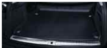
Tapis de coffre