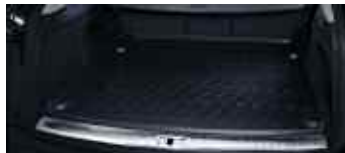
Insert de coffre