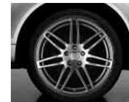
En option sur Ambition Luxe, S line et Avus: jantes Audi exclusive en aluminium coulé style 7 branches doubles, 10 J x 21", avec pneus 295/35 R 21. Code PQF