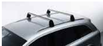
Barres de toit