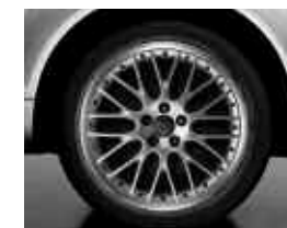
En option sur Ambition Luxe, S line et Avus: jantes Audi exclusive en aluminium coulé style 20 rayons, 9 J x 20", avec pneus 295/40 R 20. Code PQS